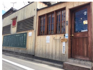
高崎市東町の既存店舗

女性の働く場を創出することで、地域における女性のキャリアアップ、子育てライフなどを応援。