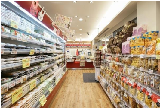
※店内イメージ写真

オープンするのは群馬県の交通の中心、高崎駅に直結した駅ビルモンレーのコンコースフロア。日常的に駅をご利用頂いている方はもちろん、近郊にお住まいの多くのお客様にも気軽にご利用頂けます。