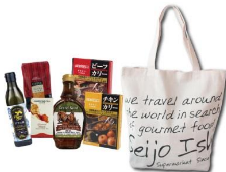
ハッピーバッグ「グロサリー」