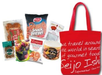
ハッピーバッグ「お菓子」